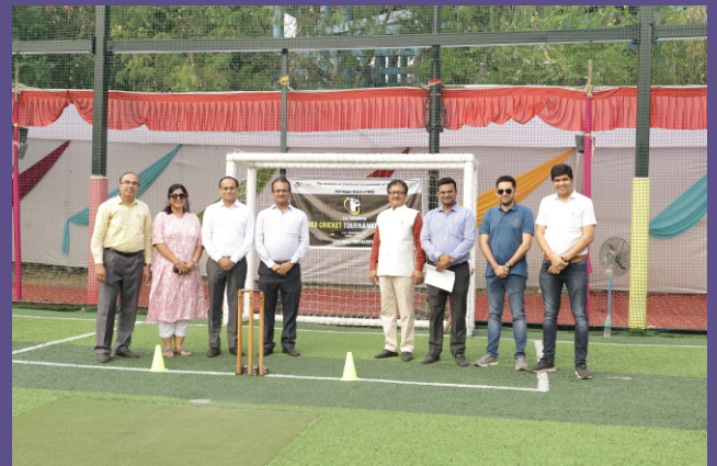
All Vidarbha Box Cricket Tournament