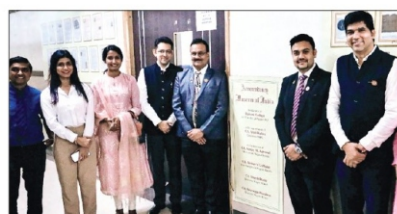
निदेशक, रायसोनी विज्ञान स्कूल ने कार्यक्रम की शोभा में बहाना।