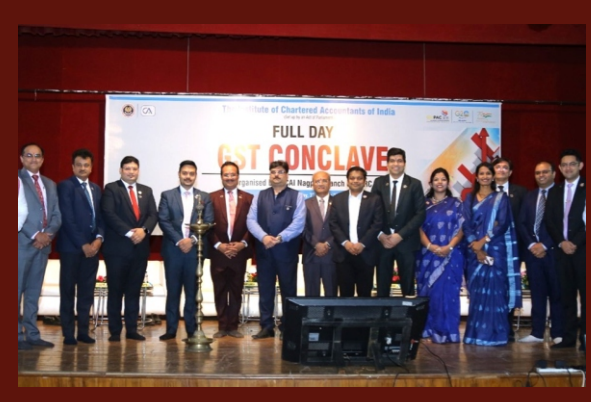
Full Day GST Conclave