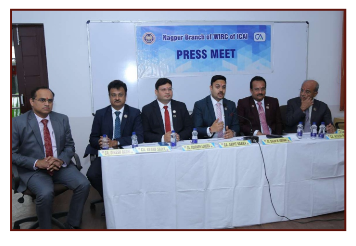
Press Meet CA Arpit Kabra, Hon'ble Chairman WIRC