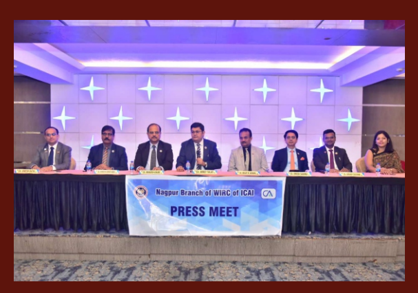
Press Meet with CA. Aniket Sinil Talati, Hon'ble President ICAI